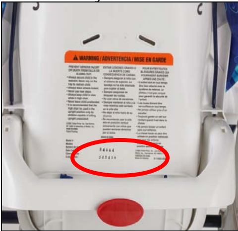
Silla Healthy Care™