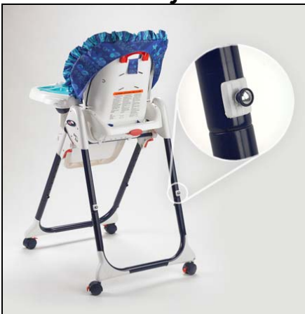
Silla Alta Healthy Care™ con clavija para guardar la bandeja