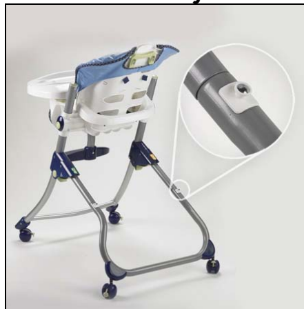
F-P Trona Cerca de Mi con clavija para guardar la bandeja